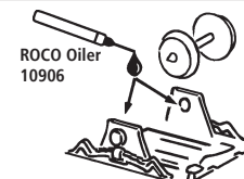
ROCO Oiler 10906

Les pièces de finition illustrées sont à monter par le modéliste. Le jeu de pièces peut comprendre d'autres pièces (non illustrées) qui sont destinées à autres versions du modèle et qui sont superflus à la variante présente.